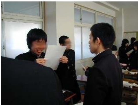
ペア・リピーティングの様子