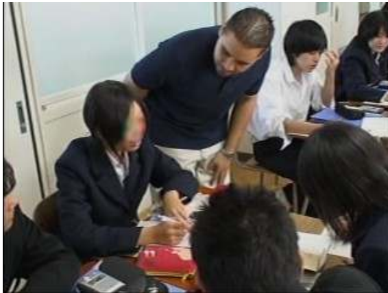
ブレインストーミングⅠ