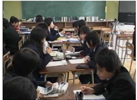
ブレインストーミングⅡ