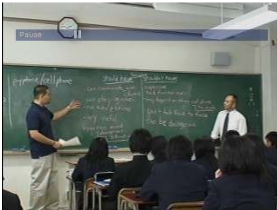
ALTとJTEによるサンプルディスカッション