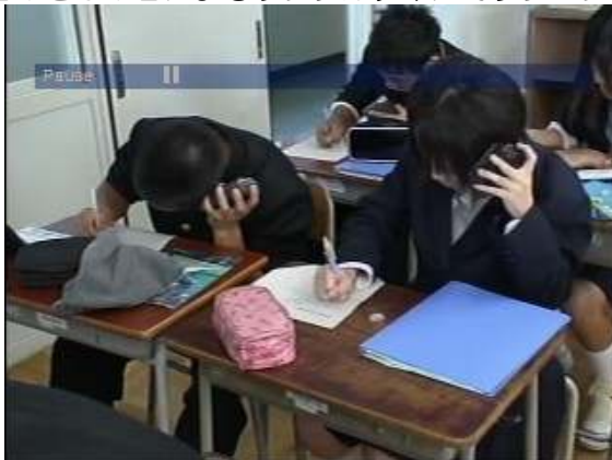
ディクテーションⅠ