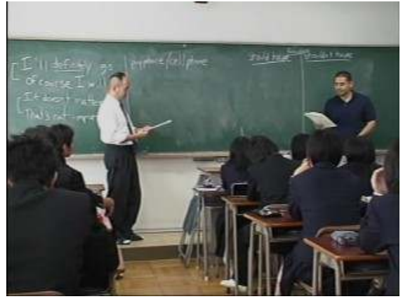
ALTとJTEによるロールプレイ