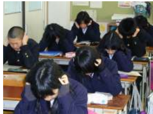
シャドーイングの様子